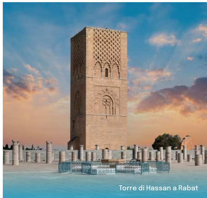
Torre di Hassan a Rabat

Colazione in hotel. Partenza verso Rabat, la capitale amministrativa del paese. Visita della torre di Hassan, le cui quattro facciate presentano tutte una decorazione diversa; del mausoleo di Sua Maestà Mohammed V, simbolo dell'indipendenza nazionale, restaurato nel 1956 e situato nella grandiosa cornice della moschea di Hassan in puro stile arabo-musulmano; il Mechouar, vasta spianata su cui sorge il Palazzo Reale; il giardino di Oudayas, di stile andaluso, autentica oasi di pace e bellezza. Partenza per Meknès. Visita della vecchia capitale di Moulay Ismail: da non perdere le porte monumentali di