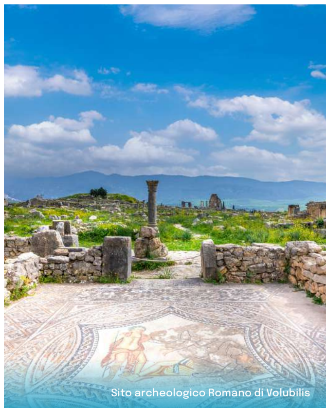
Sito archeologico Romano di Volubilis

Bab El Khemis, Bab Mansour, la piazza El Hedhim.